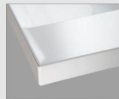
H プレーンホワイト