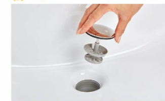
排水口の中までスポンジでサッと掃除できます。排水口を通しやすい大口径φ55の排水口です。