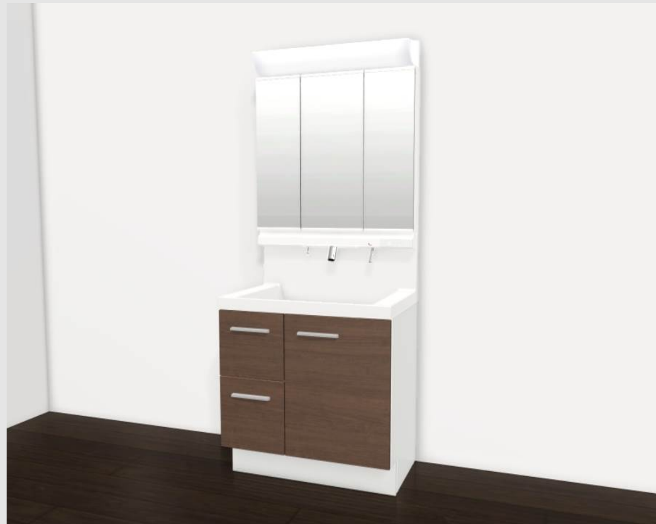
CG合成によるイメージ画像です。