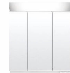
スタンダードLED照明・3面鏡・全収納 MEB-753TXS