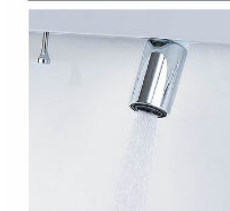
シャワー吐水 水ハネの少ない微細シャワーは従来比の20%の節水ができます。