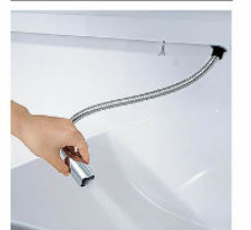
ホースを引き出して使えるので、ボウル手前に水を流すこともできます。