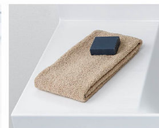
カウンターは 仮置きスペースにピッタリ。