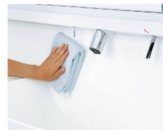
一体成形カウンターで お手入れ簡単。